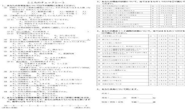
図1 こころのチェックシート。実際はA4用紙に印刷されている。

https://gair.media.gunma-u.ac.jp/dspace/bitstream/10087/6689/1/62_41.pdf