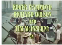
グレナダテレビ「シャーロックホームズの冒険」第2シリーズ赤髪組合より19世紀末ロンドンの smog