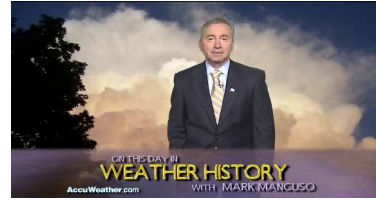
AccuWeather.com 特別番組より1952年の "Great London Smog" 事件 http://www.youtube.com/watch?v=Z0LNZjpo1CE